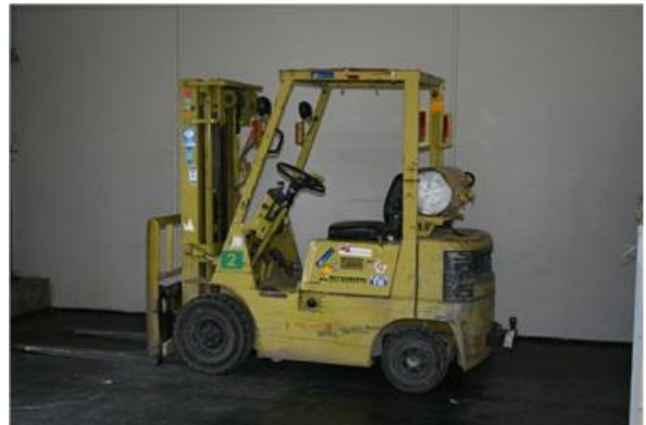
Der eiserne Helfer macht Pause. Er hat viel Handarbeit abgenommen.