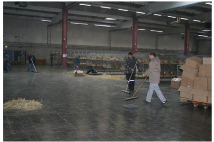
Besetzanz in Halle 2. Es ist fast vollbracht.