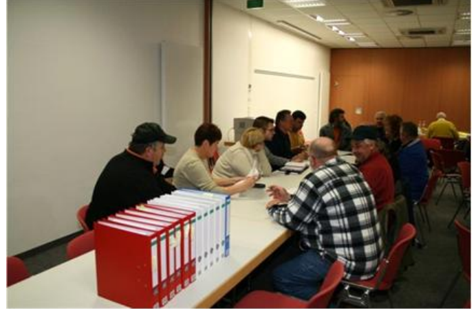
Letzte Lagebesprechung vor der Schau. „Mein Gott haben wir Ordner gefüllt“.