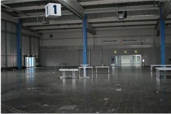
Halle 1, nach der Weihnachtsfeier von Ratiofarm, blieb heute noch unberührt. Es war doch nicht alles Geld verspekuliert.

Im folgenden Bildbericht möchte ich die Stimmung übermitteln und jeden dazu auffordern uns in Ulm zu besuchen, denn die Landesschau zeigt jetzt schon sehr gute Rahmenbedingungen. Die Käfige sind mit breiten Gängen versehen; es gibt genügend Platz für die Züchtersgespräche bei den Tieren. Trotz der Größe der Hallen, sind die Wege kurz.